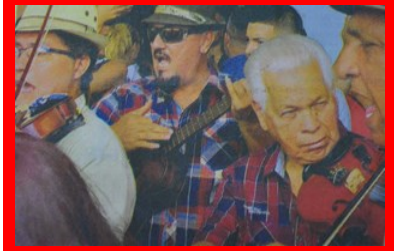
Amigonan musical den parada di Dande